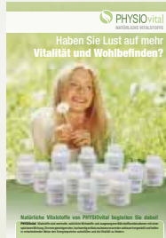
Produkt-Poster Format DIN A2 (420 x 594 mm) Art.-Nr. 8110

PHYISOvital Testsatz zur energetischen Testung 21 Glasröhrchen, davon 12 Röhrchen gefüllt mit je einer Kapsel der einzelnen PHYISOvital Produkte, 9 Glasröhrchen können individuell befüllt werden. Art.-Nr. 8100