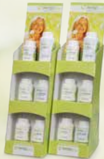
1 Verkaufsdisplay klein (153 x 395 x 195 mm) Art.-Nr. 8106