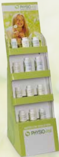
1 Verkaufsdisplay groß (310 x 930 x 450 mm) Art.-Nr. 8105