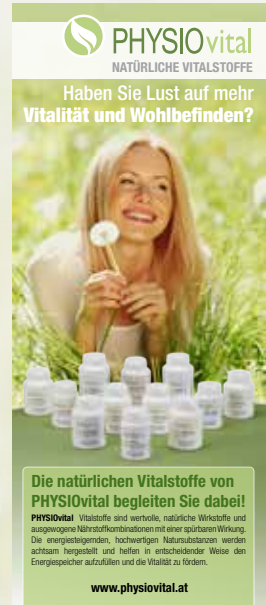
Produkt Rollup Display (850 x 2000 mm) Art.-Nr. 8115